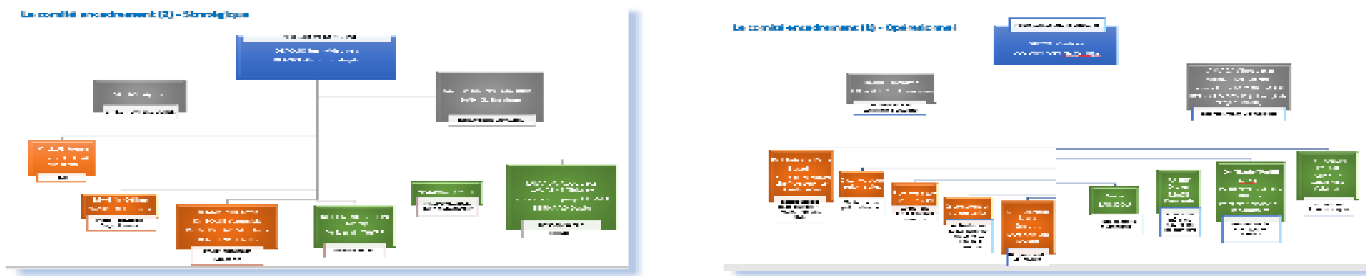
Fig. 2. Organisation d'un comité stratégique (Direction) et d'un comité opérationnel (Exécutif)